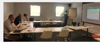
Jour 1 – Cadre réglementaire santé-sécurité

Mardi 12 septembre, le Pôle Industriel HSE lançait pour la 2 ème année le Cycle SSE : Devenir Animateur Santé Sécurité Environnement - 5 jours de formation à la carte.